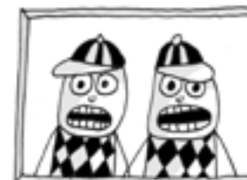
ΟΙ ΑΔΕΛΦΟΙ ΜΟΥΣΙΑ