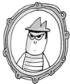
ΡΟΝΙ ΜΠΡΑΝΑΓΚΑΝ (ΝΤΕΚΤΙΒ)